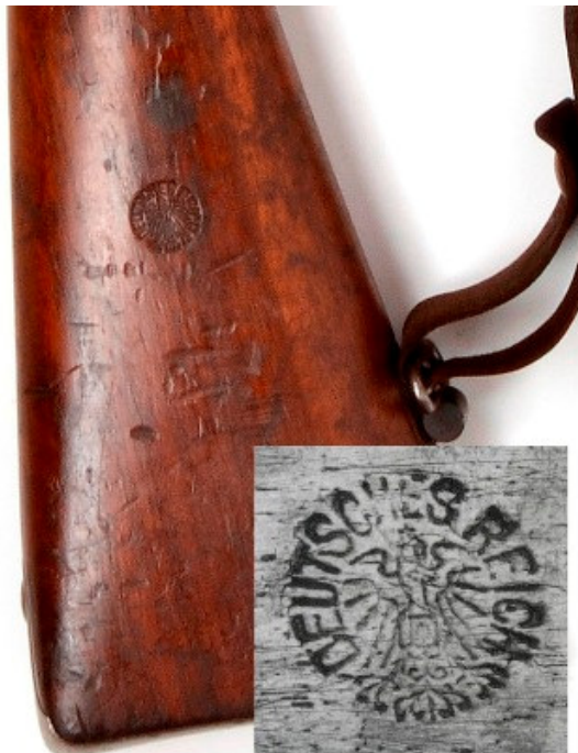
Afbeelding -12- Detailopname van een Nederlandse Beaumont karabijn. Het cartouche in de kolf "DEUTSCHES REICH" geeft aan dat deze karabijn in de Eerste Wereldoorlog in de bewapening van Duitsland is opgenomen. Foto en collectie Legermuseum. Inventarisnummer 019915.