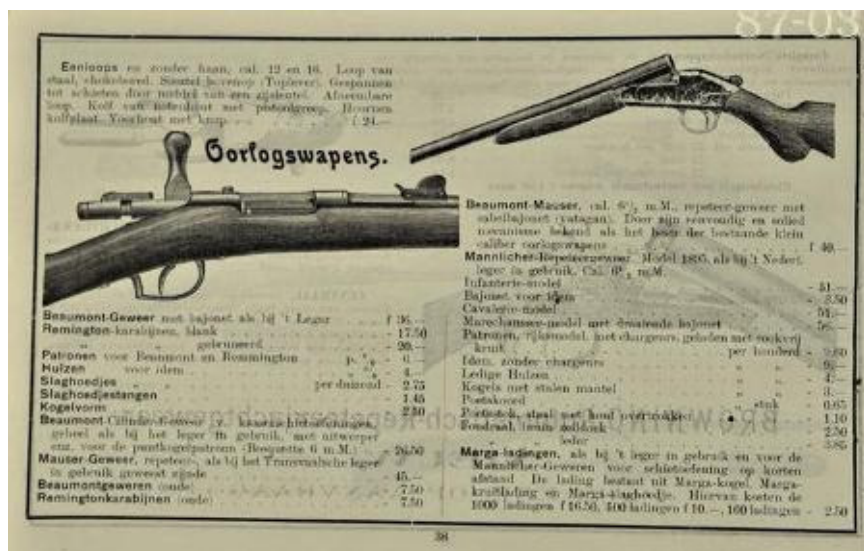
Afbeelding -10-