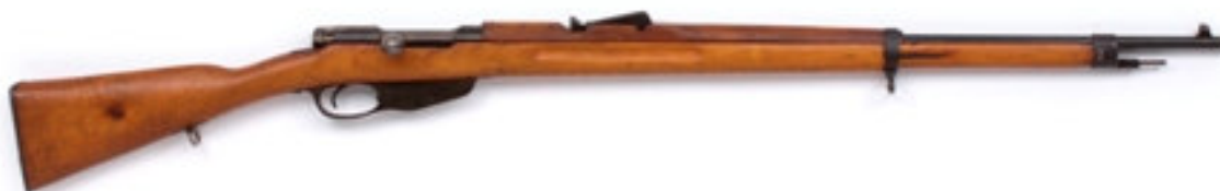
Afbeelding -7- Een Nederlands M95 geweer, rechter zijde.