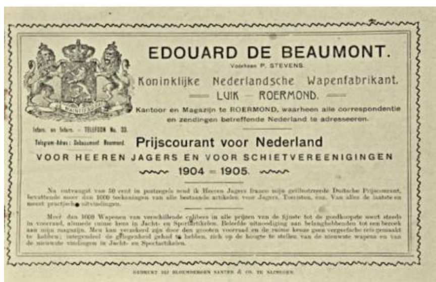
Afbeelding -9