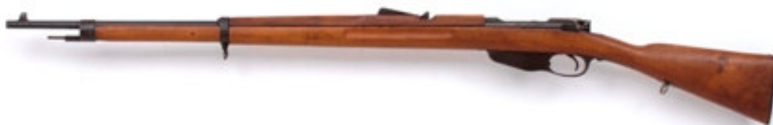
Afbeelding -6- Een Nederlands M95 geweer, linkerzijde.

geleverd. Daarna zijn er door Steyr tot 1902 alleen nog onderdelen geleverd waarvan bij AI ongeveer nog eens 30.000 M95's zijn samengesteld.