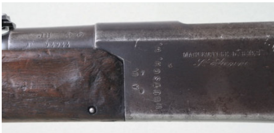
Afbeelding -11- Detailopname van een in de Eerste Wereldoorlog op de Fransen buitgemaakt Lebel Mle 1886 geweer. De afkorting "A D. DEUTSCH. R." (Artilleriezeug Depot Deutsches Reich) is op de systeemkast gestempeld.

Het gebruik van, op de vijand buitgemaakte, wapens was volgens de conventie van Den Haag toegestaan (29 juli 1898, sectie III, artikel 53). Het meenemen als oorlogsouvenir van, op de vijand buitgemaakte, wapens door individuele militairen was echter verboden. Buitgemaakte geweren werden van een stempel op de systeemkast of de kolf voorzien zodat herkenbaar was dat ze eigendom waren van het Duitse Rijk. Helaas werden de wapens in de praktijk niet altijd gemerkt zodat ook ongemarkeerde wapens mogelijk tijdens WO-I wel als buitwapen zijn ingezet.