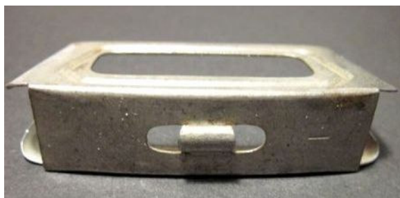
Afbeelding -5- 6,5 x 53,5R patroonhouder. De korte streep die in de rechterzijde van de bodem is ingeslagen geeft aan dat deze is gemaakt bij Königliche Gewehrfabrik in Berlin-Spandau in Duitsland. Dat is opmerkelijk omdat Spandau alleen voor de Duitse overheid produceerde. Wanneer deze patroonhouders gemaakt zijn en waarvoor ze bestemd waren is helaas niet met zekerheid te zeggen. Collectie Derk Jan Besselink, foto Wilhelm Micke.

Het commerciële Oesterreichische Waffen Fabriks Gesellschaft (OEWG) uit Steyr, patenthouder van het magazijnontwerp van von Mannlicher, won een rechtszaak tegen de Duitse overheid waardoor OEWG de rechten verkreeg om eveneens Gewehr 88's te produceren. Naar aanleiding van een opdracht van de Roemeense autoriteiten verbeterde Otto Schoenauer (technisch directeur OEWG) het ontwerp van het Gewehr 88. Van dit nieuwe geweermodel werden 5000 stuks Puska (geweer) Md.1892 Kaliber 6,5x53,5R op 27 januari 1892 aan Roemenie geleverd 5 . De Md.1893, opvolger van de Md.1892, werd voorzien van magazijn verstevigingsranden en op de voorste kordonbeugel werd een pen aangebracht voor opstelling in roten. Tot 1912 heeft OEWG zo'n 410.000 stuks Md.1893's aan Roemenie geleverd.