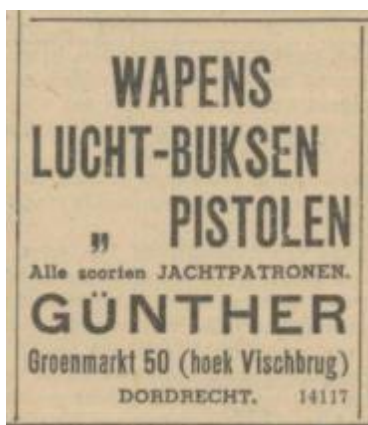
Afbeelding 28 Advertentie uit de Bredasche Courant van 27 oktober 1939.