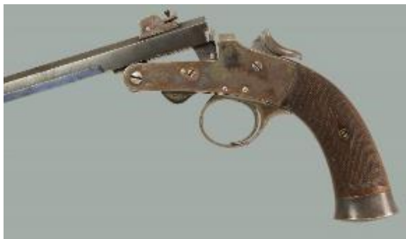
Afbeelding 24 Ancion Marx Flobert pistool