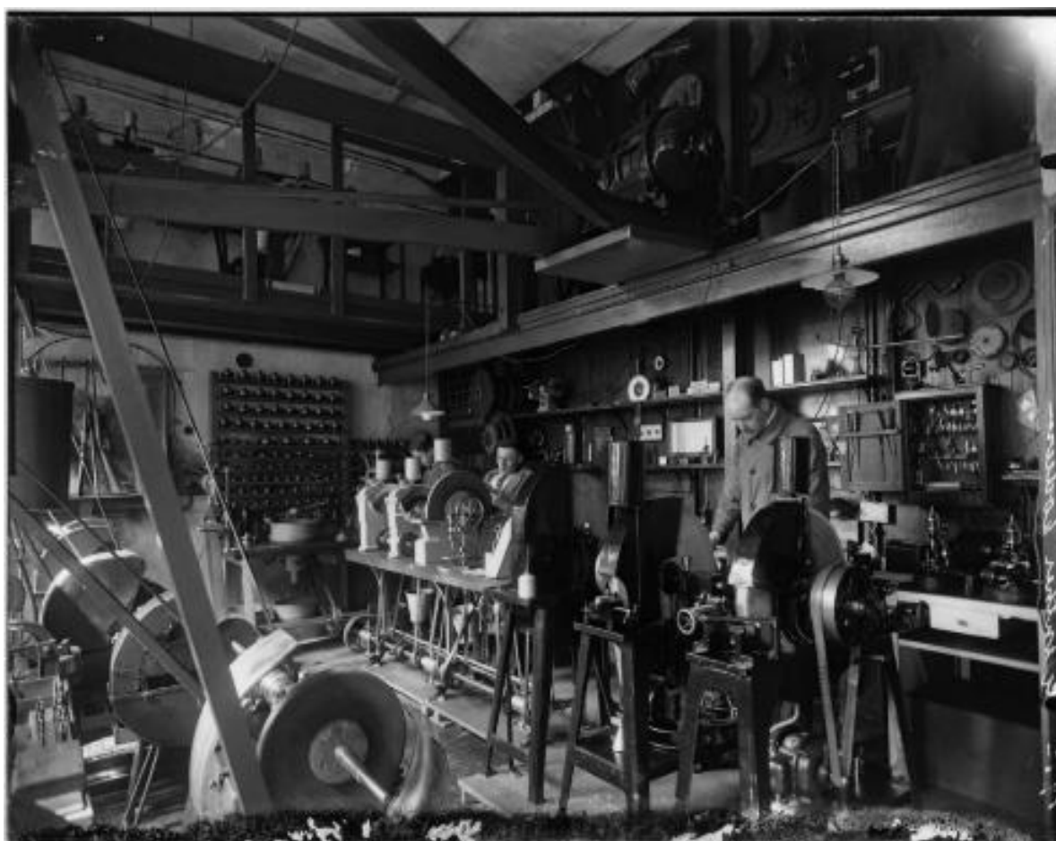
Afbeelding 20 Interieur van instrumentmakerij W.B. Günther aan de Groenmarkt uit de periode 1920 – 1924.

Op de foto's van het interieur van de werkplaats zijn omstreeks 1920, 10 stuks slijpstenen en 3 medewerkers te zien. De bus/flesvormige reservoirs hielden de stenen met water nat. Helaas is een belangrijk deel van de werkplaats niet zichtbaar. Wat voor werkzaamheden werden er toen verricht? Zouden er de bestekmessen, die in de etalage lagen, gefabriceerd zijn? Het is niet zeker maar de voorzieningen waren er. Ik heb het gevraagd aan 2 bevriende opticiens en zij zeggen unaniem dat op dit op soort slijpmachines ook de brillenglazen, die op de juiste sterkte als ronde lenzen van tussen de 50 en 55 millimeter worden ingekocht, op de maat van het montuur werden geslepen. Op de werkbanken staan apparaten om glas te snijden en er staan glas/optiek boormachines. De 2 grote slijpmachines op de voorgrond met inspan mogelijkheden waren waarschijnlijk wel alleen bedoeld voor staalwaren. Het is voor ons wat teleurstellend maar het zou best eens kunnen dat men in de werkplaats, vanaf de jaren 20, de meeste tijd bezig was met optiek en het slijpen van messen, ongeveer zoals de scharenslijp.