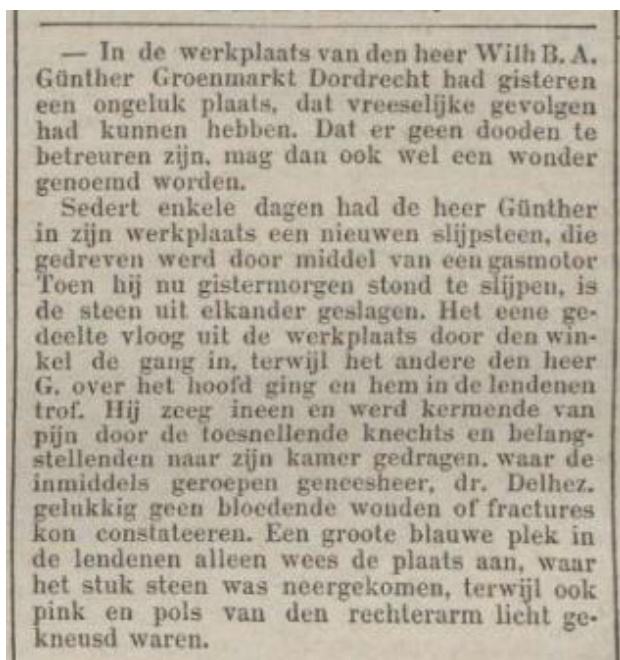
Afbeelding 5 Het Rotterdamse Nieuwsblad 30 augustus 1893

Op 1 februari 1893 werd er door de Burgemeester aan W.B.A. Günther vergunning afgegeven voor een gasmotor van 2 PK. Gasmotoren (uitgevonden door Étienne Lenoir in 1862 en in 1878 verbeterd door Nikolaus Otto) werden aangedreven met lichtgas. Voor kleine vermogens was de gasmotor een goed alternatief voor de stoommachine. De Dordtse gasfabriek, voor de productie van lichtgas, was al in 1852 in bedrijf genomen ten behoeve van verlichting door gaslampen. Dat de nieuwe gasmotor de slijpstenen in de werkplaats met veel kracht deed ronddraaien blijkt enkele maanden later uit een krantenartikel van 30 augustus 1893.