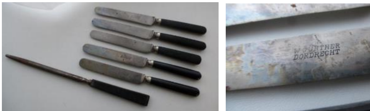
Afbeelding 8 en 9 Bestekmessen, gesigneerd met W. Günther Dordrecht.

muurschildering zichtbaar met de tekst "Wilh.B.A. Günther verbandartikelen". In de gevel zit rechts naast de 4 hoge ramen van de werkplaats een deur naar het balkon boven het water (Voorstraathaven). Op dat balkon (plankier) vond op 8 dec 1909 een explosie plaats waarbij een 20 tal ruiten sneuvelde. Volgens de overleveringen werd er ook regelmatig vanaf het balkon, of vanuit het raam, in het water, proef geschoten. De foto is genomen na 1902 (de Visbrug is toen verbreed) maar nog voor 1906. Het kleinere hoekpand met puntdak is namelijk in 1906 grondig verbouwd.