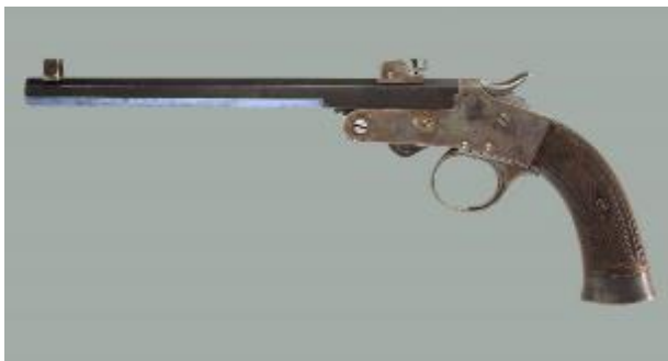
Afbeelding 23 Ancion Marx Flobert pistool