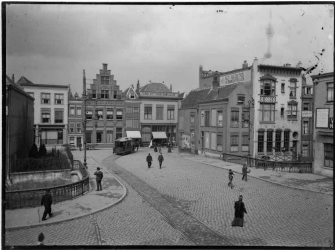
Afbeelding 7 Foto van de Visbrug. De paardentram rijdt zojuist de Groenmarkt in. Rechts van de brug is de witte achtergevel van het pand van Günther aan de Voorstraathaven te zien. Op de zijgevel is bovenaan een witte