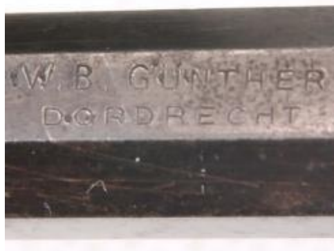
Afbeelding 25 Signatuur op de loop van het Ancion Marx Flobert pistool