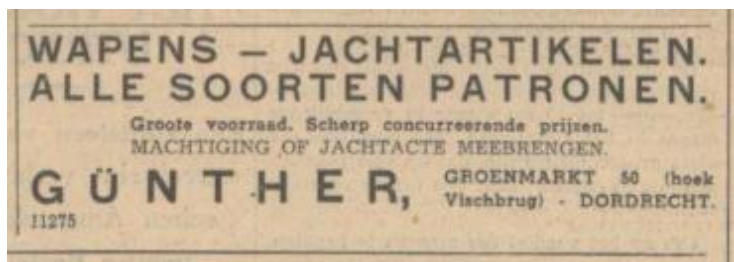
Afbeelding 27 Advertentie uit de Bredasche Courant van 3 juni 1939