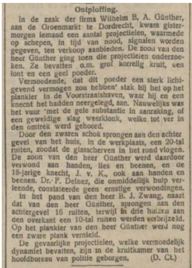
Afbeelding 12 Godsdienstig Staatskundig Dagblad van 8 december 1909.

De kop van dit artikel in Wapenfeiten is "Instrumentmaker W.B.A. Günther". Dat is de juiste aanduiding, het was niet alleen een wapenhandel. Er werden wel altijd wapens verkocht. In de winkel lagen ook verbandartikelen en medische instrumenten te koop. Ook toen, meer dan 100 jaar geleden, was een belangrijke bron van inkomsten die als opticien. In oude advertenties en foto's van de etalage zijn verder een grote hoeveelheid messen, scharen, barometers en andere instrumenten te zien. In Wapenfeiten gaat het ons er uiteraard om wat er door de firma zoal op wapengebied aan activiteiten heeft plaatsvonden. De vergunning uit 1909 bevat een blauwdruk van het interieur van de winkel met de werkplaats aan de Groenmarkt 68 en geeft een goed beeld van hoe 110 jaar geleden de indeling is geweest.