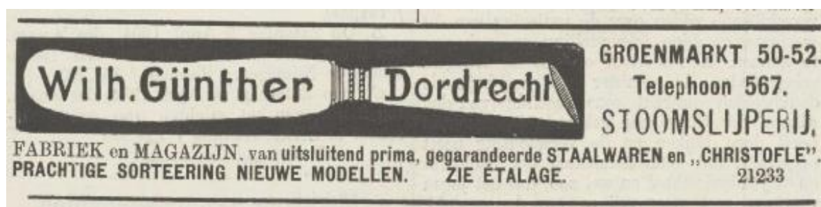
Afbeelding 10 Advertentie uit de Dordrechtse Courant van 16 maart 1904. Günther adverteerde met de tekst "STOOMSLIJPERIJ" terwijl er in 1893 al vergunning was verleend voor de installatie van een 2 PK gasmotor. Was de term stoomslijperij destijds nog een algemene aanduiding voor een werkplaats met slijpmachines? Het wekt enigszins de suggestie dat het afgebeelde bestekmes, zoals het destijds bij Günther werd verkocht, daar ook geproduceerd werd. Toch is het maar de vraag of men dit inderdaad bedoelde. De in de advertentie vermelde "CHRISTOFLE" is namelijk de merknaam van een Franse fabrikant van bestek die is opgericht in 1830.

Op 17 december 1904 kreeg Günther vergunning "tot het oprichten van eene bewaarplaats van een vaatje buskruit inhoudende 25 Kg". Waar dat kruit, voortaan opgeslagen in een stenen kluis in de kelder, "in gesloten koperen, zinken of houten kisten, omgeven met haren of wollen kleden" in 1904 nog voor bestemd was valt niet precies uit het stuk op te maken. Over vuurwerk wordt niet meer geschreven. Wel wordt nog vermeld dat "in den kelder ... geen patroonhulzen, slaghoedjes, patronen tot vuurwapenen ... voorhanden mogen zijn". En "het buskruit wordt bewaard voor verkoop in het klein". Ging het om een handelsvoorraad herlaadkruit voor jachtpatronen?