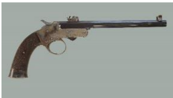
Afbeelding 22 Ancion Marx Flobert pistool