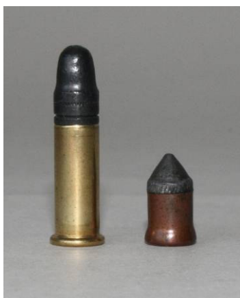
Rechts op de foto een afbeelding van een vroeg model 6 mm Flobert patroon. Let op de conisch toelopende rand van de huls. De rand heeft de tapse vorm zoals Louis Nicolas Auguste Flobert deze aanvankelijk gebruikte. Pas later zou de rand de uitgestulpte vorm krijgen zoals we die kennen van de moderne.22 Long Rifle (ter vergelijking links op de foto afgebeeld). Het kwikzilver werd over het gehele oppervlak van de hulsbodem aangebracht. Tijdens de percussie werd de gehele achterzijde van de hulsbodem ingedeukt, dus niet alleen de rand.

Op het moment dat ik dit schrijf is er 42 jaar verstreken sinds mijn uitvinding, zonder enige complicaties, en is er nog geen beter wapen geïntroduceerd dan het mijne. Alleen de revolver heeft zijn weg gevonden. Laat ik er snel aan toevoegen dat hij niet hetzelfde doel vervult. Mag ik erop wijzen dat het een zowel defensief als offensief oorlogswapen is die helaas maar al te vaak in de handen van criminelen valt. Door deze gevaarzetting vervangt de revolver noch mijn pistool, noch mijn karabijn die vredelievende middelen om te oefenen zijn.