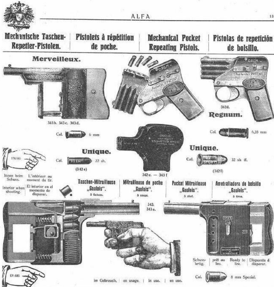
Afbeelding uit een catalogus van het Duitse Adolf Frank Export Gesellschaft uit 1911, dus meer dan 60 jaar nadat Auguste Flobert zijn gelijknamige wapens op de markt bracht. Naast het meer bekende 5 schots, kaliber 8 mm centraalvuur Gaulois palm pistool wordt ook geadverteerd met een 6 schots 6 mm randvuur Merveilleux palm pistool. Er is geen link naar Flobert behalve de naam "Merveilleux" die hier in 1911 kennelijk nog steeds gebruikt werd. De Gaulois kostte DM 53,- en de Merveilleux was te koop voor DM 33,-.

koperen huls, dat wil zeggen, de patroon voorzien van een kogel. Door het schot valt de koperen huls vanzelf en wordt de haan opnieuw gespannen. Op deze wijze kan een vuursnelheid van 10 patronen per minuut bereikt worden. De patroon, eenvoudig geconstrueerd, tegen minimale kosten, is samengesteld uit een buisje, geladen met een beetje kwikzilver fulminaat, met perslucht en voorzien van een kogel aan het uiteinde.