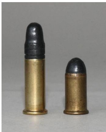
Foto van de weinig imposante 6 mm Merveilleux speciaal patroon van de vorige afbeeldingen. Links, ter vergelijking van de afmetingen een .22 long rifle patroon. (Collectie Jan van Gelderen)

De hoeveelheid pistolen en karabijnen volgens het Flobert systeem, gemaakt in Frankrijk en in het buitenland, is zo aanzienlijk dat de Franse handel, wapenfabrieken en slaghoedjesfabrieken hiervan veel geprofiteerd hebben. Verder, de miljoenen francs die zijn ontvangen door de staat, via de Douane, vanwege transport, import en export.